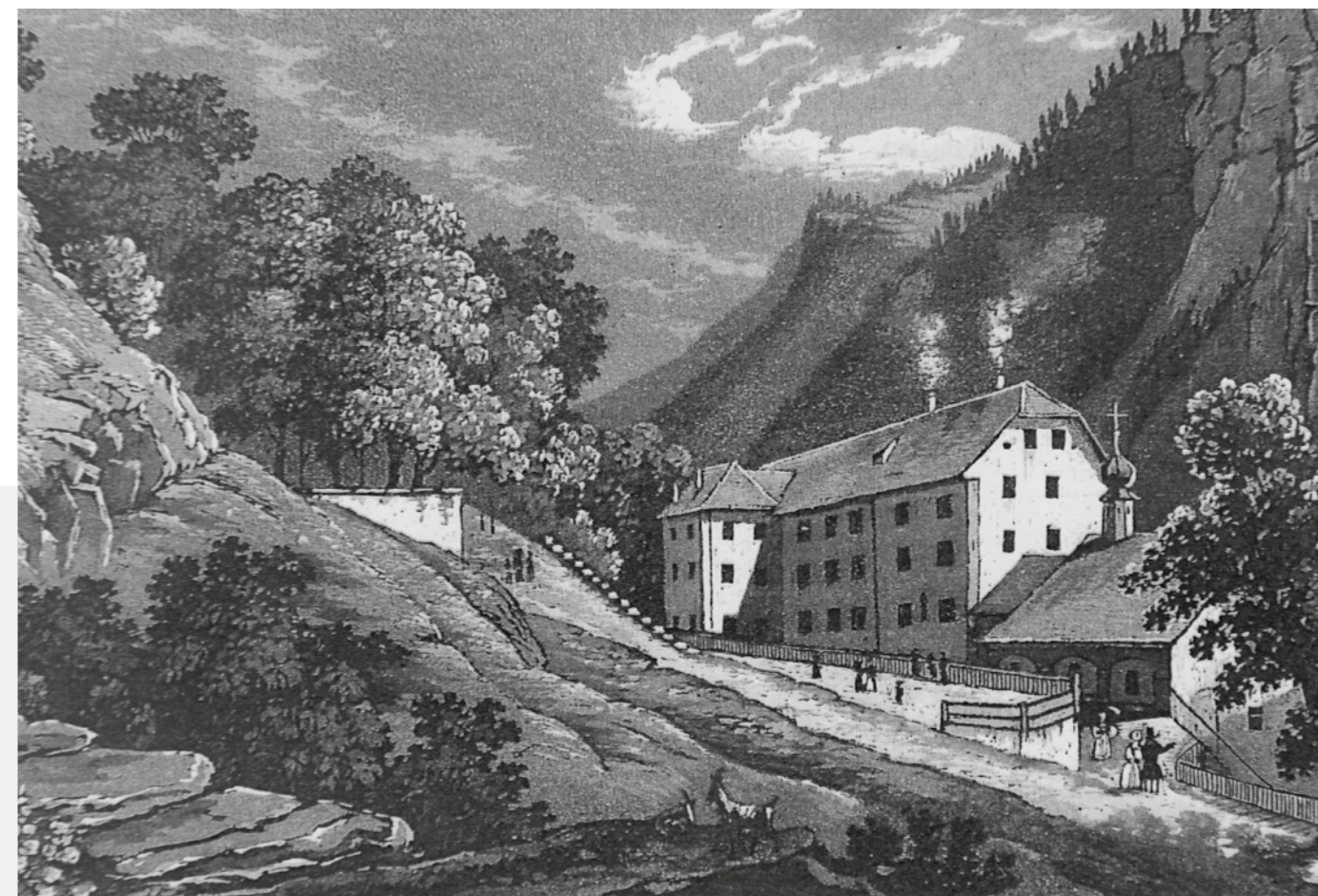
Das Badehaus in der Taminaschlucht, 18. Jh.