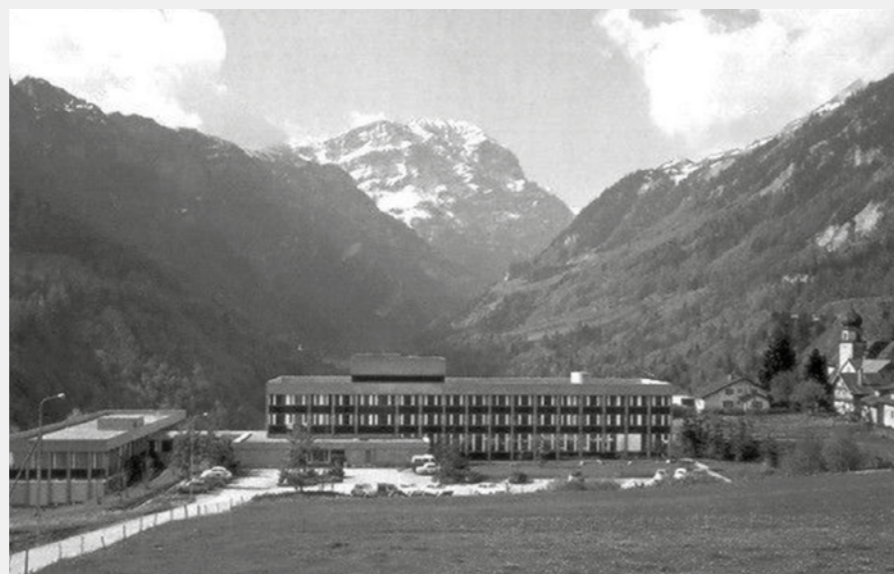
Das Rheuma- und Rehabilitationszentrum Valens um 1970

Der Arzt Theophrastus Bombastus Aureolus Philippus, genannt Paracelsus (1493–1541), wirkt im Bad und publiziert die erste Badeschrift über die Therme von Pfäfers.