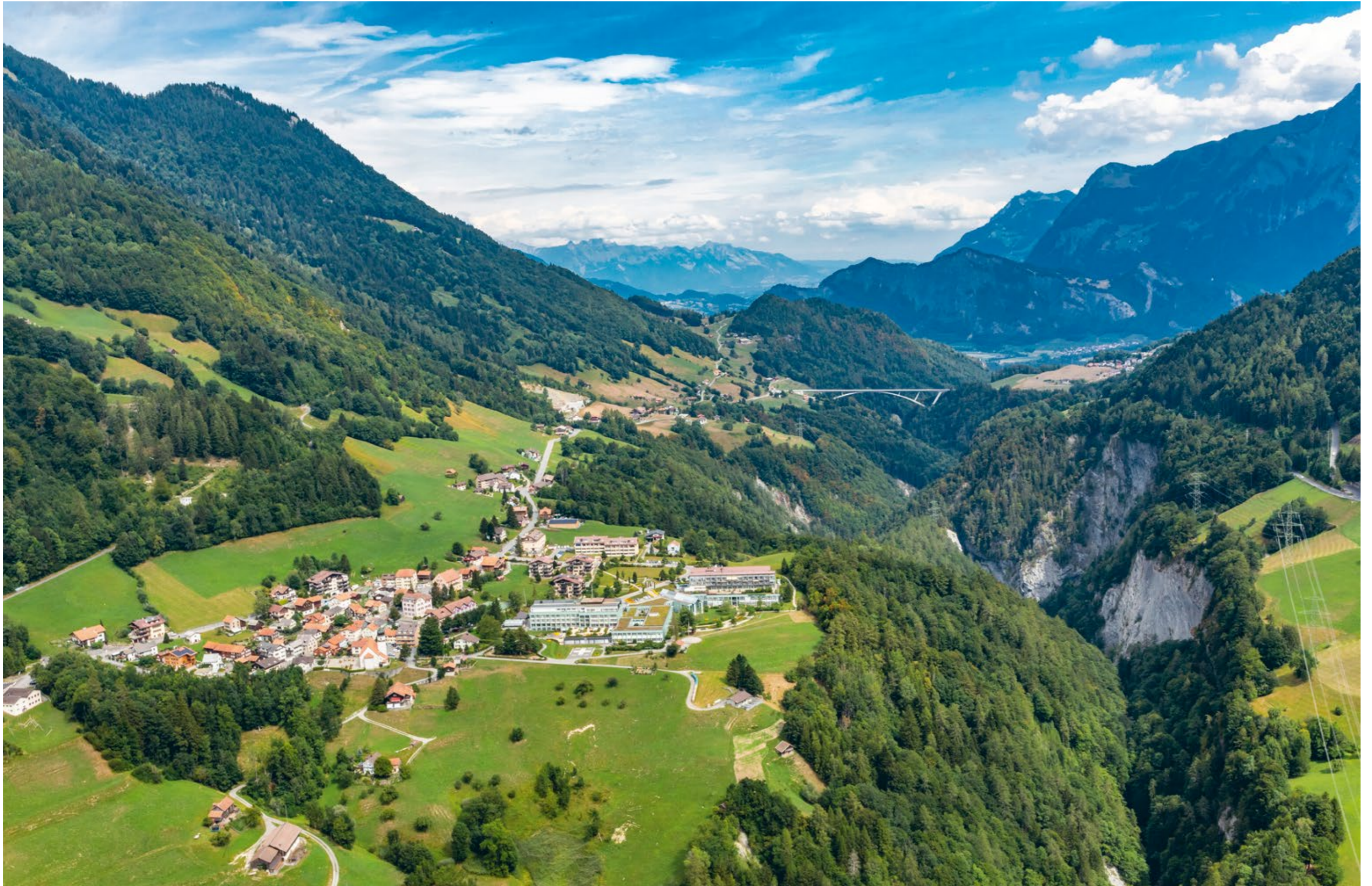
Valens mit Rehasentrum, Taminaschlucht und Taminabrücke